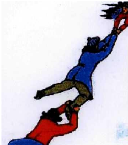
НАДАННЯ ДОПОМОГИ ПОТОПАЮЧОМУ ПОДАЧЕЮ РУКИ

КОЛИ ВИ ПРОВАЛИ- ЛИСЬ ПІД ЛІД, РОЗКИ- НЬТЕ РУКИ, НАМА- ГАЙТЕСЬ ВИЙТИ НА МІЦНИЙ ЛІД, КЛИЧТЕ НА ДОПОМОГУ