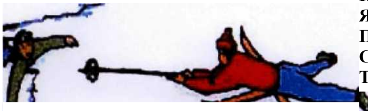
НАДАННЯ ДОПОМОГИ ПОТОПАЮ- ЧОМУ ЗА ДОПОМОГОЮ ЛИЖ І МОТУ- ЗКИ. ДОПОМАГАЮЧИ ПОТОПАЮЧО- МУ, НАБЛИЖАЙТЕСЬ ДО НЬОГО ПО- ПОВЗОМ. КРАЩЕ ОБПИРАТИСЬ НА ДОШКУ АБО ЛИЖІ

КОЛИ РЯТІВНИКІВ ДВОЄ, ТО КРАЩЕ, ЯКЩО ДРУГИЙ БУДЕ ТРИМАТИ ПЕРШОГО ЗА НОГИ, А ПЕРШИЙ, В СВОЮ ЧЕРГУ, ПОДАСТЬ РУКУ ПО- ТОПАЮЧОМУ